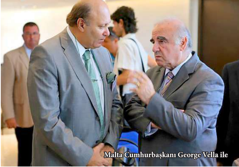
Malta Cumhurbaşkanı George Vella ile

şahadetnamesi alınması gerekir. Sağ olsunlar her seferinde büyükelçilikler ve konsolosluklarımız mesai ölçülerini dışında çok gayret gösterdiler.