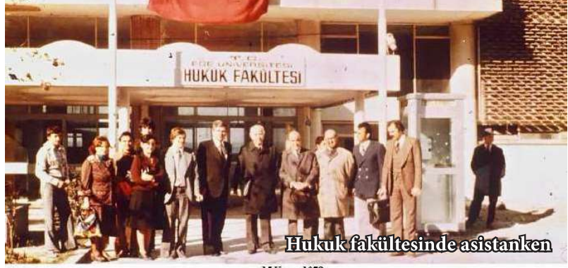
Hukuk fakültesinde asistanken

Meslek yaşamımın başında kısa bir süre üniversitede akademik kariyer dönemim oldu. Daha sonra Dokuz Eylül Üniversitesi Hukuk Fakültesi'ne dönülecek olan Ege Üniversitesi Hukuk Fakültesi'nde öğretim görevlisi olarak çalıştım. Genç bir asistan olarak fakültenin kurucular fotoğrafında ben de varım. Sekiz yıl tam kadro akademisyenlik yaptım. Mevzuat