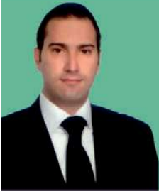
Av. Barış Çalık*