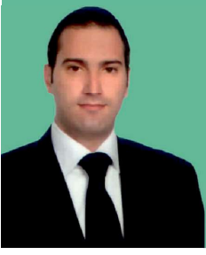
Av. Barış Çalık