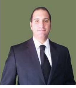
Av. Barış Çalık