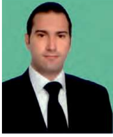
Av. Barış Çalık