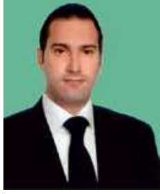
Av. Barış Çalık