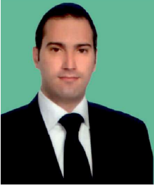
Av. Barış Çalık